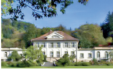
Villa Mez Zentrale in Freiburg www.eos-ep.de