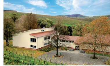
Schullandheim am Kaiserstuhl www.eos-ep.de