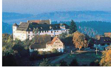
Schloss Hohenfels Tagungszentrum am Bodensee www.schloss-hohenfels.de